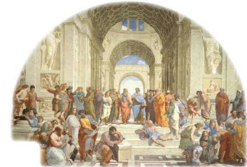
Die Schule von Athen

„Philosophie ist Wissenschaft vom Seienden, insofern es seiend ist.“ Aristoteles